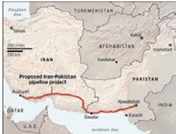
Şekil 2: İran-Pakistan Boru Hattı Projesi

İran-Pakistan gaz boru hattı 1990'lı yılların başlarında tasarlanmış bir projedir. Başlangıçta İran-Hindistan-Pakistan gaz boru hattı projesi olarak başlanmışsa da Hindistan 2009 yılında güvenlik ve maliyet nedeniyle projeden çekilmiştir. İran doğal gazı taşıyacak boru hattının yaklaşık 1.900 km uzunluğunda olması öngörülmektedir.